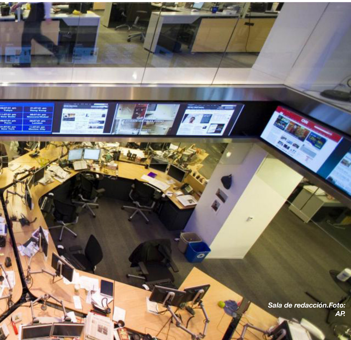
Sala de redacción.

La agencia de periodismo de investigación ProPublica presentó un análisis sobre cuánto tardan en atender las salas de emergencia en los hospitales de Estados Unidos. Los datos recogidos fueron del periodo octubre del 2012 y septiembre del 2013. La última actualización de la información fue en agosto de 2014. Hasta diciembre, reunieron 35 historias locales a partir de los datos mostrados. La historia está acompañada de una herramienta para comparar la información sobre la aten-